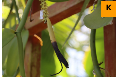
バニラ・プラニフォリア (温室)