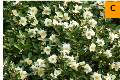
台湾ツバキ (こんこん山広場)