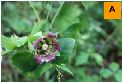
ツルニンジン (生態園)