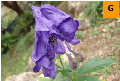
ハナトリカブト (薬用区)