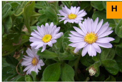
ダルマガク (連絡道)