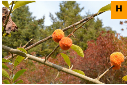
カカツガユ (連絡道)