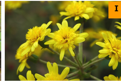
ヤエツワブキ (南園)