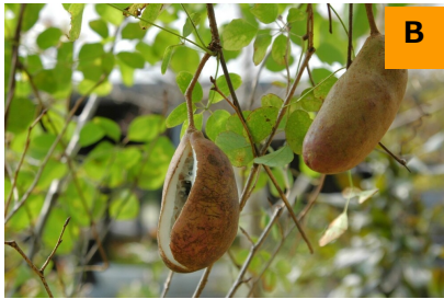
ゴヨウアケビ (回廊)