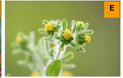
メナモミ (展示館周辺)