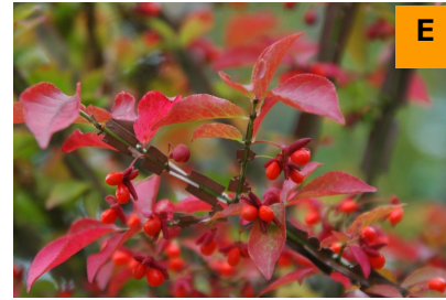
ニシキギ (展示館周辺)