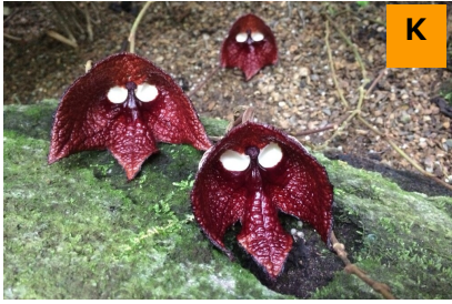
アリストロキア・サルヴァドレンシス (温室)