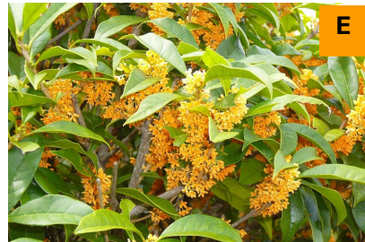
キンモクセイ (展示館周辺)