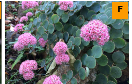
エッチュウミセバヤ (さくら・つつじ園)