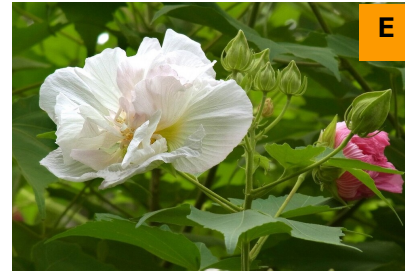
スイフヨウ (展示館周辺)