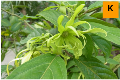
イランイランノキ (温室)