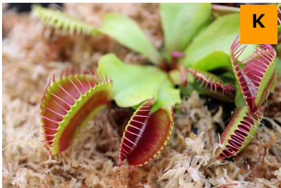
ハエトリグサ (温室)