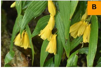
キイジョウロウホトトギス (回廊)