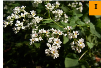
シャクチリソバ (南園)