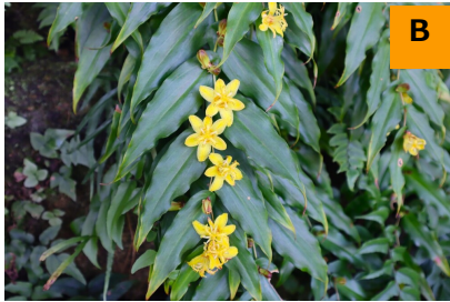
キバナノツキヌキホトトギス (回廊)