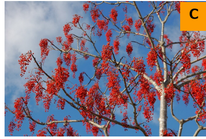
イイギリ (こんこん山広場)