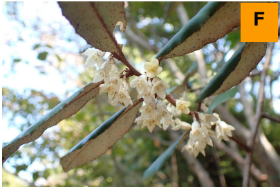
ナワシログミ (さくら・つつじ園)