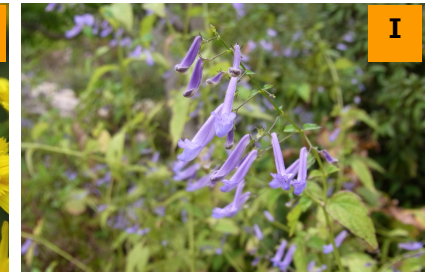
セキヤノアキチョウジ (南園)