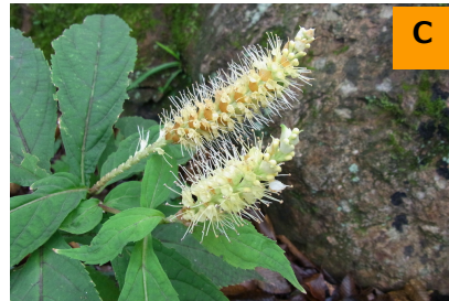
テンニンソウ (こんこん山広場)