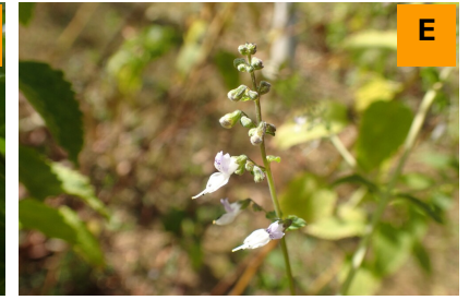
ヒキオコシ (展示館周辺)