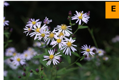
ノコンギク (展示館周辺)