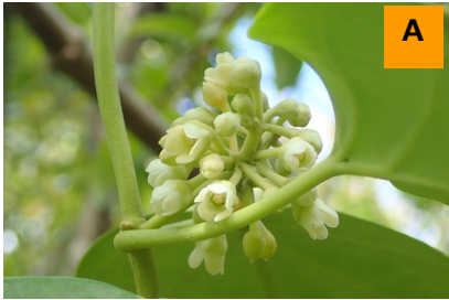
キジョラン (生態園)