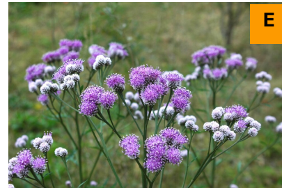
ヒメヒゴタイ (展示館周辺)