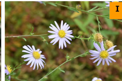
ヤナギノギク (南園)