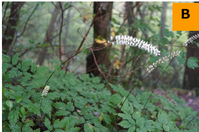
サラシナショウマ (回廊)