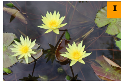
スイレン属の園芸品種‘セントルイスゴー’ (南園)