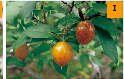
ツクバネガキ (南園)