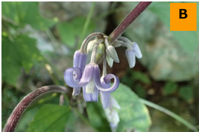
オオクサボタン (回廊)