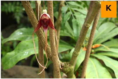
アリストロキア・トリカウダタ (温室)