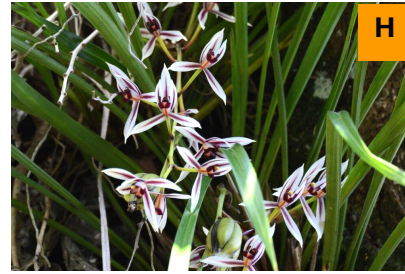
ヘツカラン (連絡道)