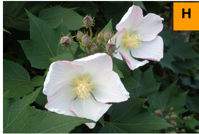
サキシマフヨウ (連絡道)