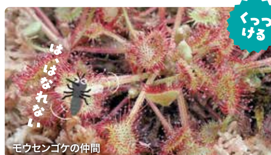
モウセンゴケの仲間