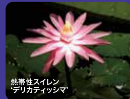
熱帯性スライム デリカディッシュマ