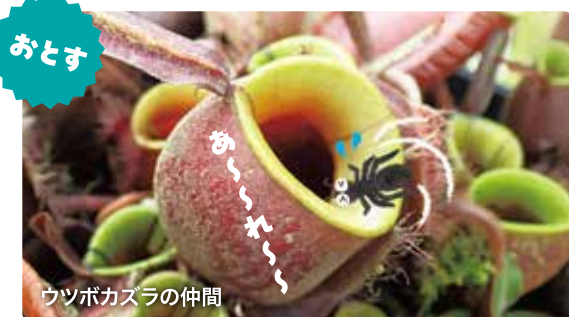
ウツボカズラの仲間