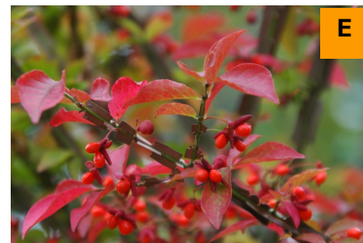
ニシキギ (展示館周辺)