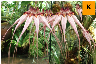
バルボフィルム・ルイス・サンダー (温室)