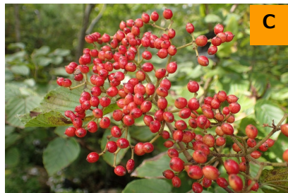
ガマズミ (こんこん山広場)