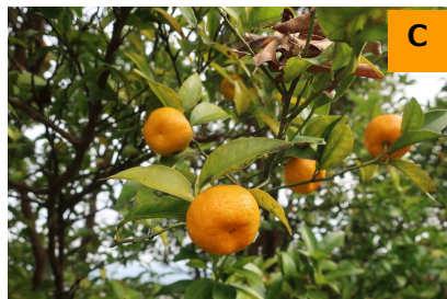
タチバナ (こんこん山広場)