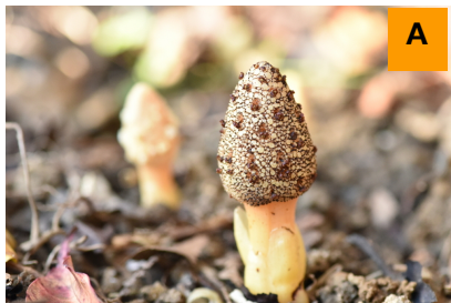
キイレツチトリモチ (生態園)