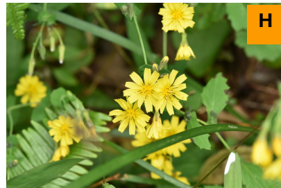
ヤクシソウ (連絡道)