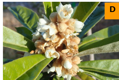
ビワ'茂木' (ふむふむ広場)