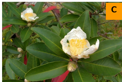
台湾ツバキ (こんこん山広場)