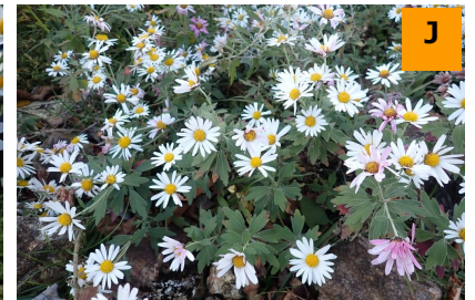
ナカガワノギク (結網山)