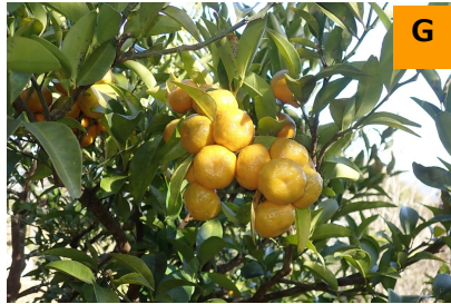
ヒラミレモン (薬用区)