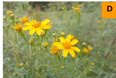
タゲテス・レモニイ (ふむふむ広場)