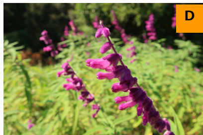
サルビア・レウカンタ (ふむふむ広場)