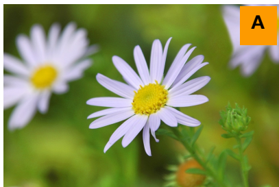
ソナレノギク (生態園)