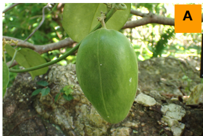
キジョラン (生態園)