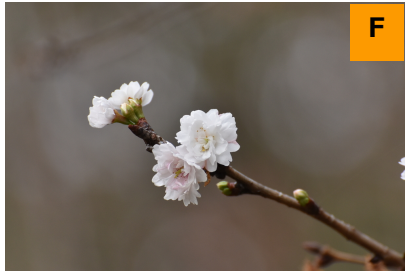
コブクザクラ (さくら・つつじ園)