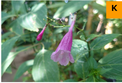
ストロビランテス・フラッキディフォリア (温室)