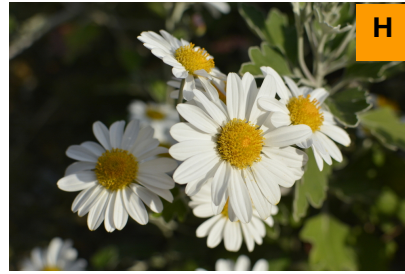
サツマノギク (連絡道)