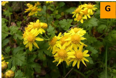
シマカンギク (薬用区)