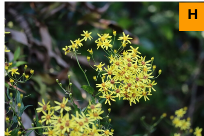
タイキンギク (連絡道)