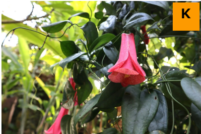
ツバキカズラ (温室)