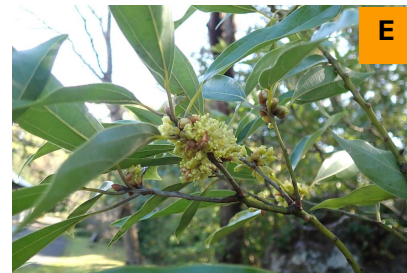
シロダモ (展示館周辺)