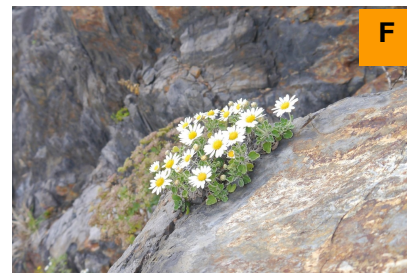
アシズリノジギク (さくら・つつじ園)