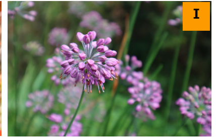
ヤマラッキョウ (南園)