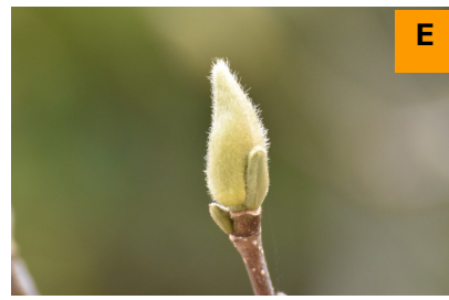
サラサレンゲ (展示館周辺)