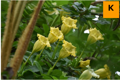
ナガラッパバナ (温室)