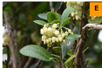
イチゴノキ (展示館周辺)