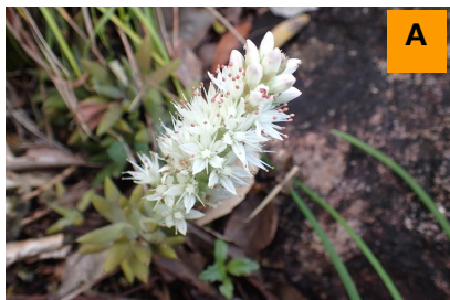
ツメレンゲ (生態園)