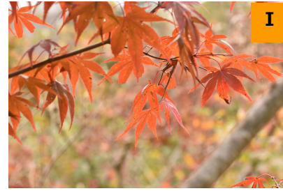
オオモミジ '野村' (南園)