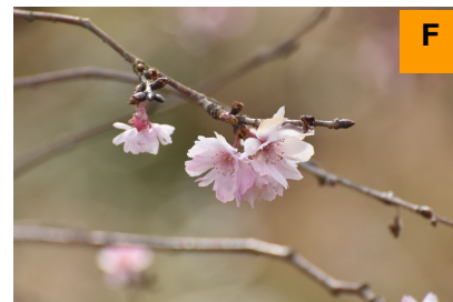
コヒガンザクラ'十月桜' (さくら・つつじ園)