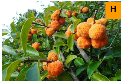
カカツガユ (連絡道)