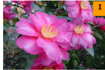
カンツバキ '勘次郎' (南園)