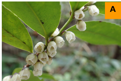
ハマヒサカキ (生態園)