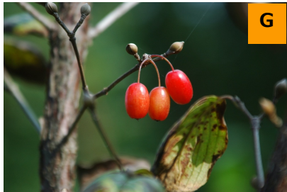
サンシュユ (薬用区)