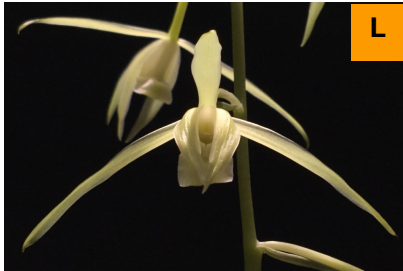
カンランの園芸品種 (寒蘭センター)