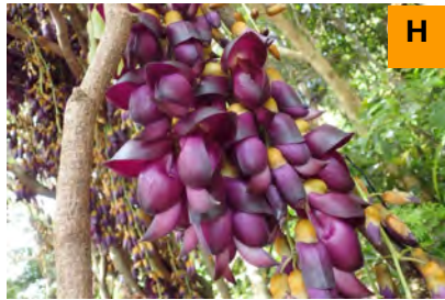
トビカズラ (連絡道)