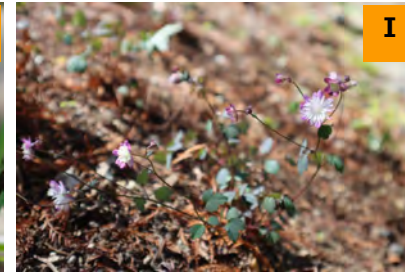
タカサゴカラマツ (南園)