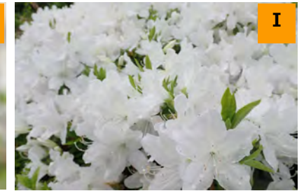
リュウキュウツツジ (南園)