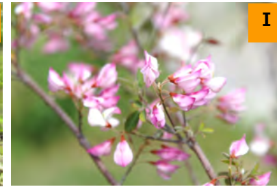
ウンナンハギ (南園)