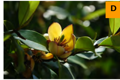
カラタネオガタマ (ふむふむ広場)