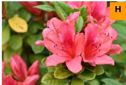
ケラマツツジ (連絡道)