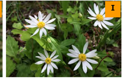
シュンシュギク (南園)