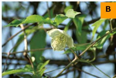
シロバナハンショウヅル (回廊)