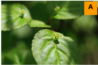
コバナハナイカダ (生態園)