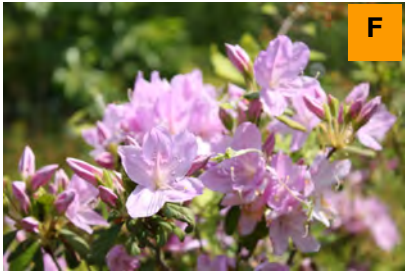
モチツツジ (さくら・つつじ園)