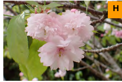
カスミザクラ'奈良の八重桜' (連絡道)