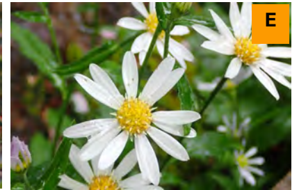
ミヤマヨメナ (展示館周辺)