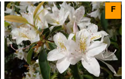
アマミセイシカ (さくら・つつじ園)