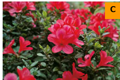
キンモウツツジ (こんこん山広場)