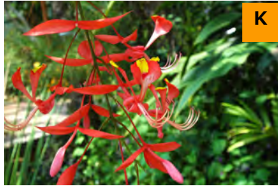
アムヘルステリア・ノビリス (温室)