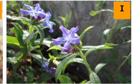
ホタルカズラ (南園)