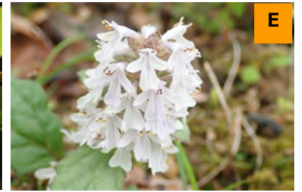
ジュウニヒトエ (展示館周辺)