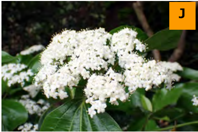
ハクサンボク (結網山)