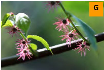
ヒメコウゾ (薬用区)