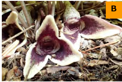
サカワサイシン (回廊)