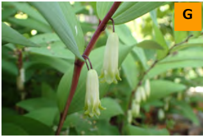
アマドコロ (薬用区)