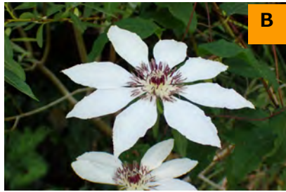
シロバナカザグルマ (回廊)