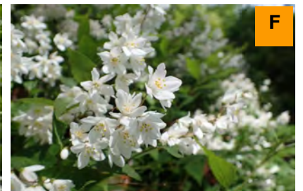
ヒメウツギ (さくら・つつじ園)