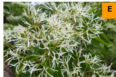
ヒトツバタゴ (展示館周辺)