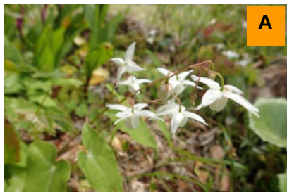
シオミイカリソウ (生態園)