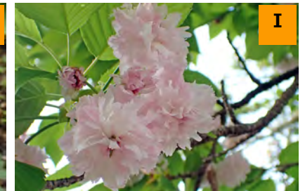
サトザクラ'菊桜' (南園)