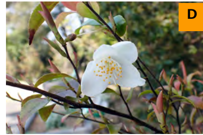
ヒメサザンカ (ふむふむ広場)