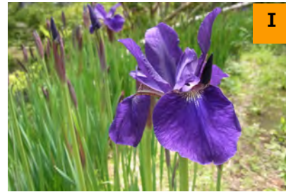
カマヤマショウブ (南園)