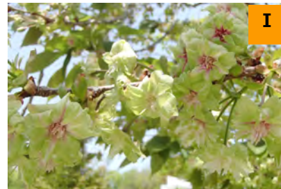
サトザクラ'御衣黄' (南園)