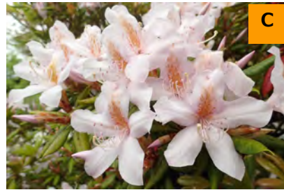
セイシカ (こんこん山広場)