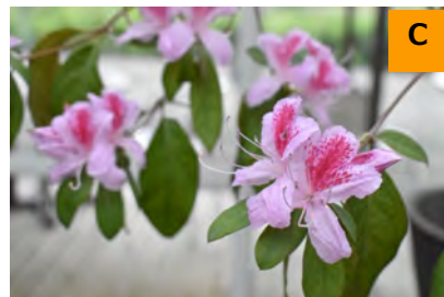
ナンオウツツジ (こんこん山広場)