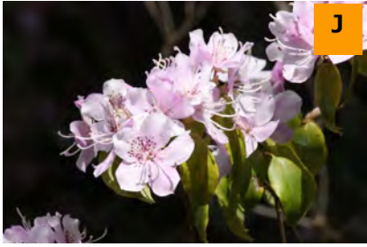
トキワバイカツツジ (結網山)