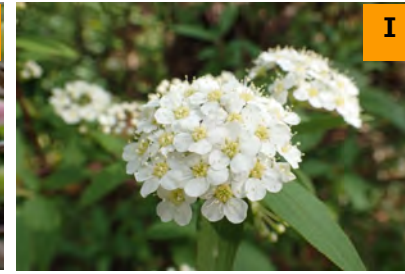
トサシモツケ (南園)