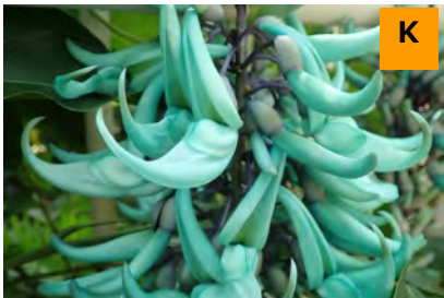
ヒスイカズラ (温室)