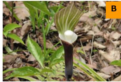
ユキモチソウ (回廊)