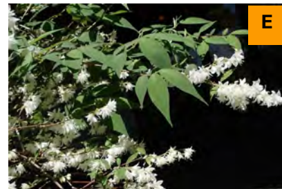
ウラジロウツギ (展示館周辺)