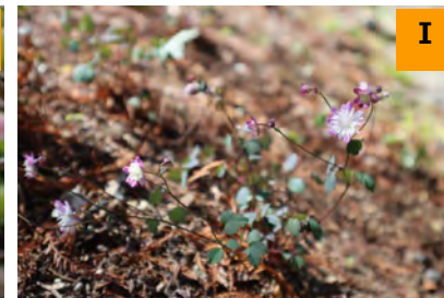
タカサゴカラマツ (南園)