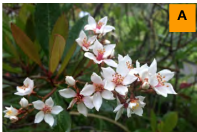
シャリンバイ (生態園)