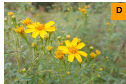
タゲテス・レモニイ (ふむふむ広場)