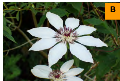
シロバナカザグルマ (回廊)