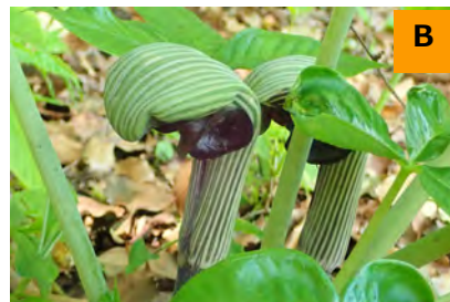
ムサシアブミ (回廊)