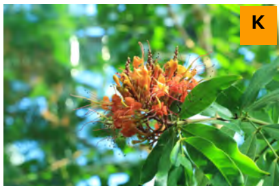
ジャボチカバ (温室)