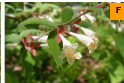
オニツクバネウツギ (さくら・つつじ園)