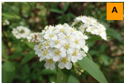
トサシモツケ (生態園)