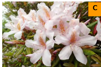
セイシカ (こんこん山広場)