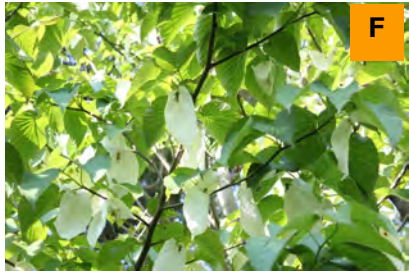
ハンカチノキ (さくら・つつじ園)