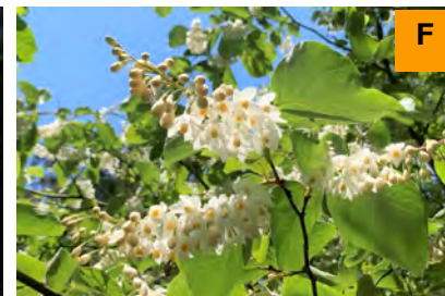
ハクウンボク (さくら・つつじ園)