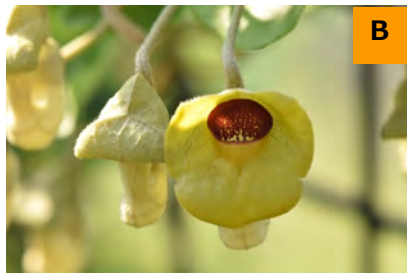
オオバウマノスズクサ (回廊)