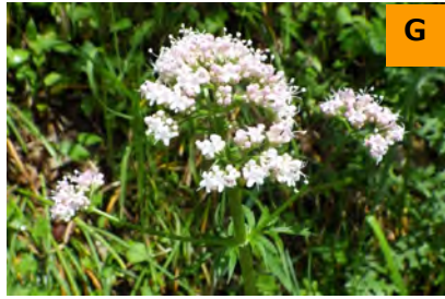
カノコソウ (薬用区)