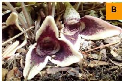
サカワサイシン (回廊)