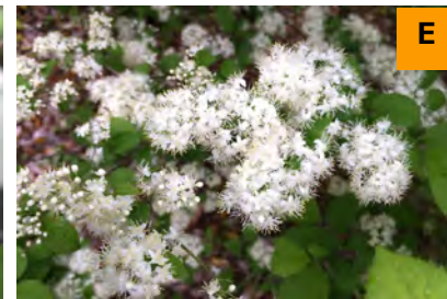
サワフタギ (展示館周辺)