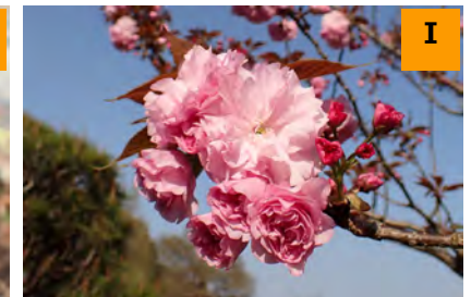
サトザクラ'関山' (南園)