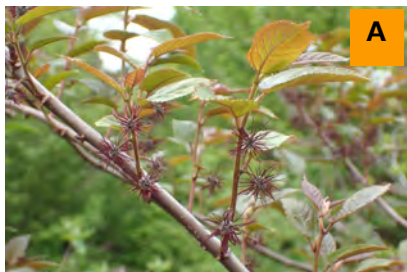
ツルコウゾ (生態園)