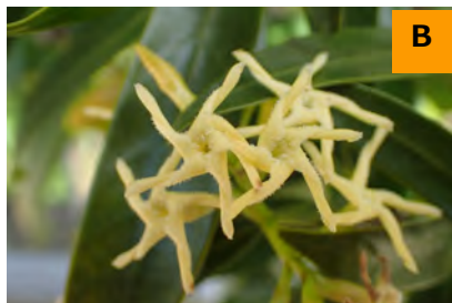
サカキカズラ (回廊)