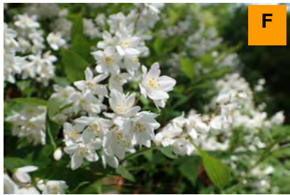
ヒメウツギ (さくら・つつじ園)