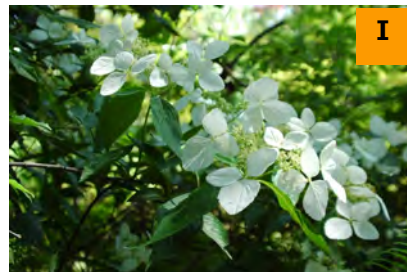
ヤクシマアジサイ (南園)