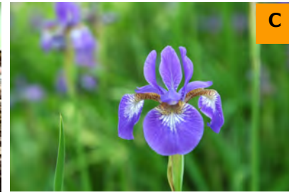
アヤメ (こんこん山広場)