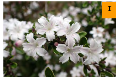
ハクチョウゲ (南園)