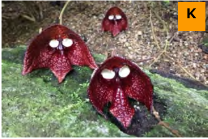
アリストロキア・サルヴァドレンシス (温室)