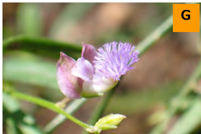
イトヒメハギ (薬用区)