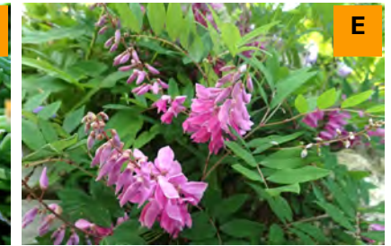
ニワフジ (展示館周辺)