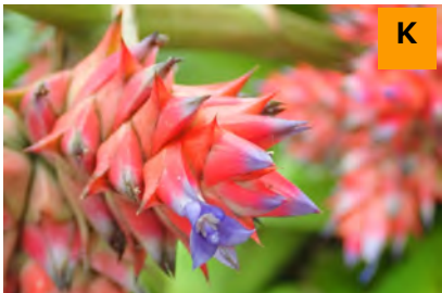
ホーエンベルギア・ステラタ (温室)