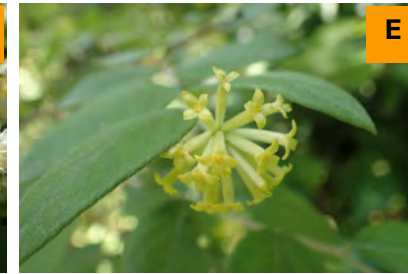
ガンピ (展示館周辺)