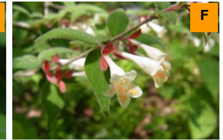
オニツクバネウツギ (さくら・つつじ園)