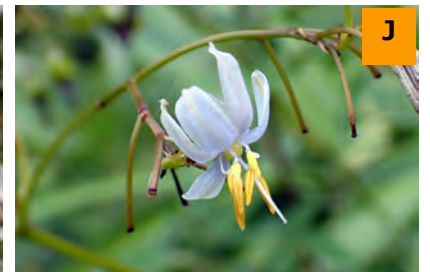
キキョウラン (結網山)