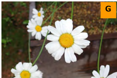
シロバナムシヨケギク (薬用区)