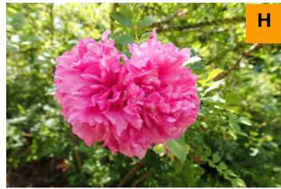
イザヨイバラ (連絡道)