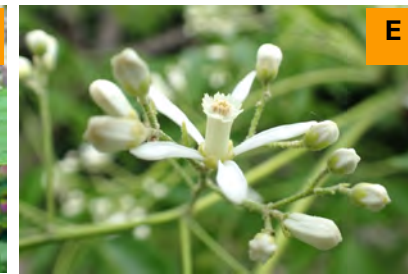
シロバナセンダン (展示館周辺)