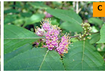
ヤブムラサキ (こんこん山広場)