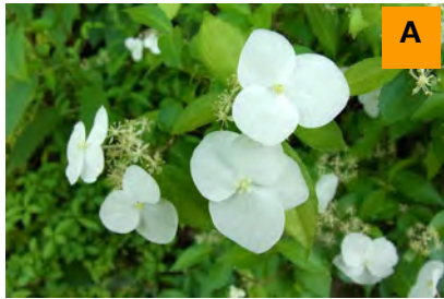
コガクウツギ (生態園)