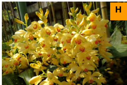
ホシケイラン (連絡道)