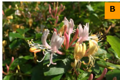
スイカズラ (桃花) (回廊)