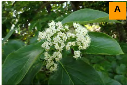
マルバチシャノキ (生態園)