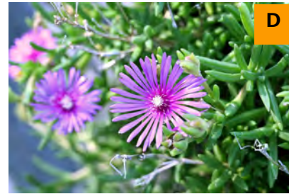
ハナランザン (ふむふむ広場)