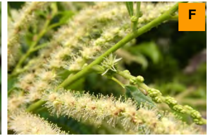
クリ (さくら・つつじ園)