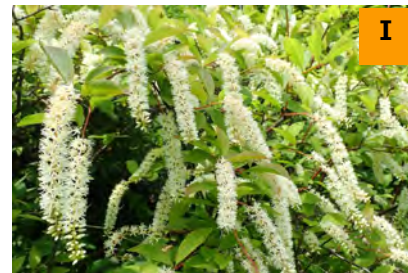
コバノズイナ (南園)