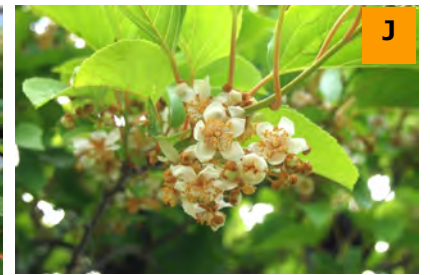
シマサルナシ (結網山)