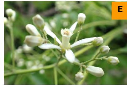
シロバナセンダン (展示館周辺)