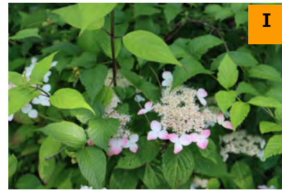
ヤマアジサイ'紅' (南園)