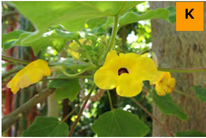
シャンプーノキ (温室)