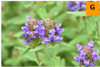
ウツボグサ (薬用区)