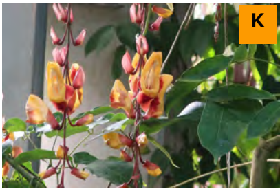
ツンベルギア・マイソレンシス (温室)