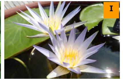
ニムファエア・カエルレア (南園)