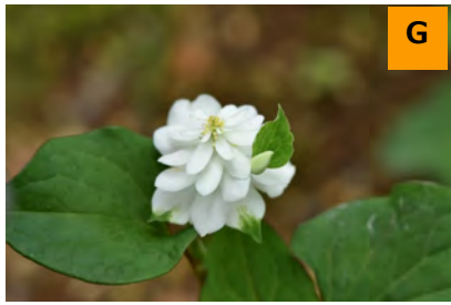
ヤエトクダミ (薬用区)