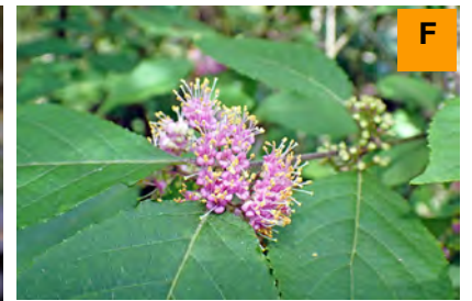
ヤブムラサキ (さくら・つつじ園)