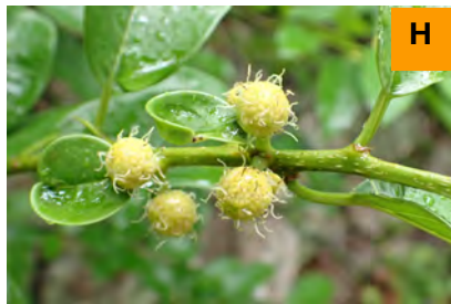
カカツゴウ (連絡道)