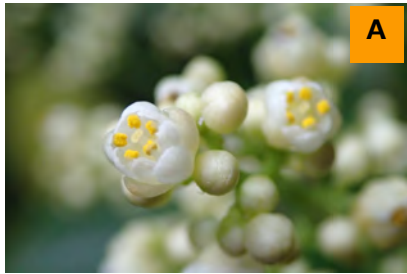
ショウベンノキ (生態園)