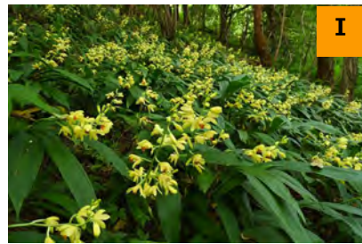
ガンゼキラン (南園)