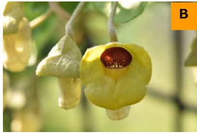
オオバウマノスズクサ (回廊)