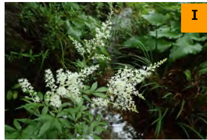
アワモリショウマ (南園)