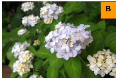
マイコアジサイ (回廊)