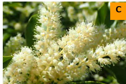
ヒラギズイナ (こんこん山広場)