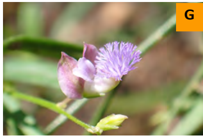
イトヒメハギ (薬用区)