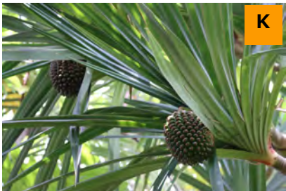
ビヨウタコノキ (温室)