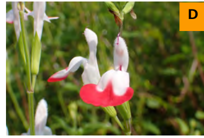
アキノベニバナサルビア (ふむふむ広場)