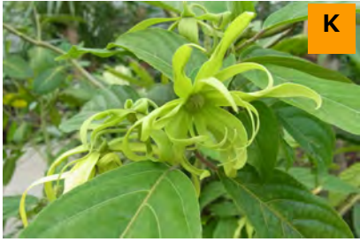
イランイランノキ (温室)