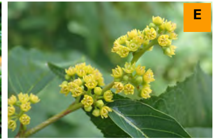
ヨコグラノキ (展示館周辺)