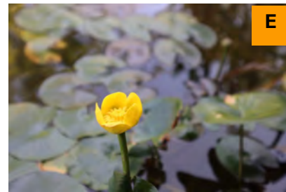
ヒメコウホネ (展示館周辺)