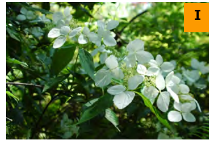
ヤクシマアジサイ (南園)