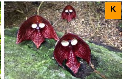
アリストロキア・サルヴァドレンシス (温室)