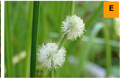
ヒメミクリ (展示館周辺)