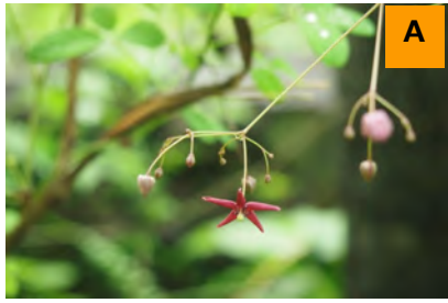
クサナギオゴケ (生態園)