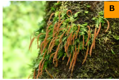
ヨウラクラン (回廊)