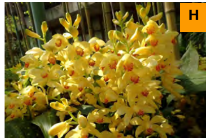
ホシケイラン (連絡道)