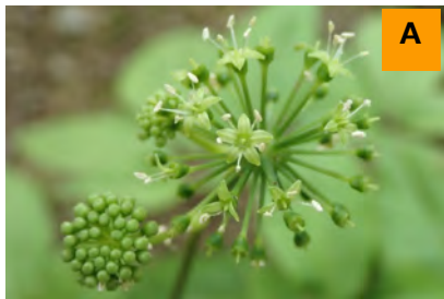
トチバニンジン (生態園)