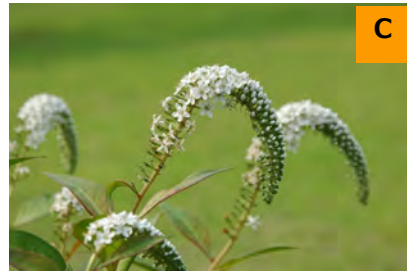
オカトラノオ (こんこん山広場)