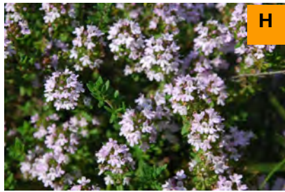
イブキジャコウソウ (連絡道)