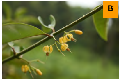
チトセカズラ (回廊)