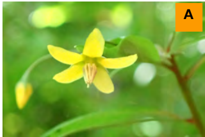
モロコシソウ (生態園)