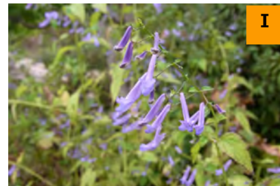
セキヤノアキチョウジ (南園)