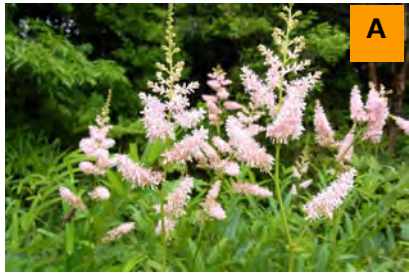
チダケサシ (生態園)