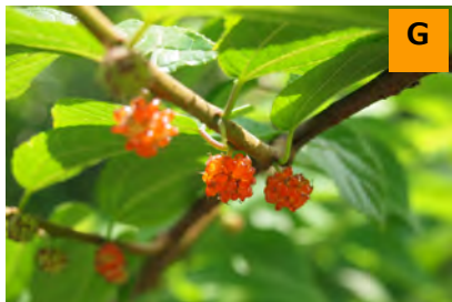
ヒメコウゾ (薬用区)