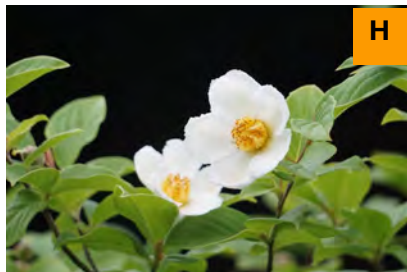
ナツツバキ (連絡道)