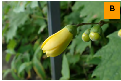
キレンゲショウマ (回廊)