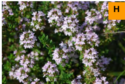
イブキジャコウソウ (連絡道)