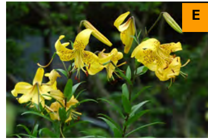
オウゴンオニユリ (展示館周辺)