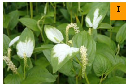
ハンゲショウ (南園)