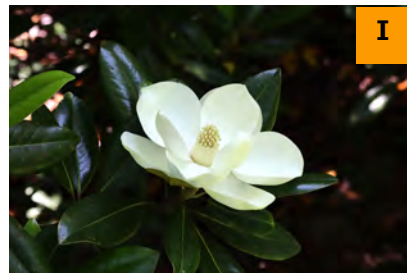
タイサンボク (南園)