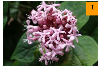
ボタンクサギ (南園)