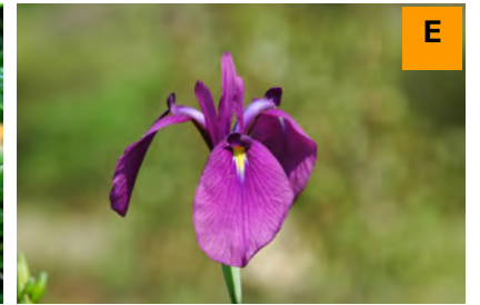
ノハナショウブ (展示館周辺)