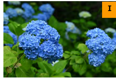
ヒメアジサイ (南園)