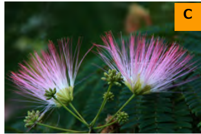
ネムノキ (こんこん山広場)