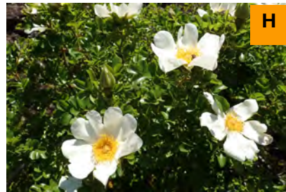
カカヤンバラ (連絡道)