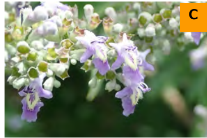
台湾ニンジンボク (こんこん山広場)