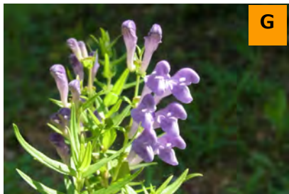
コガネバナ (薬用区)