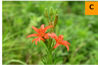
ヒメユリ (こんこん山広場)