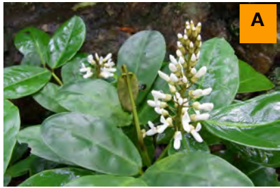
ミヤマトベラ (生態園)