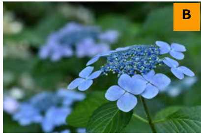
ガクアジサイ (回廊)