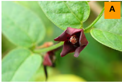
タチカメヅル (生態園)