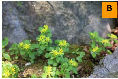
ヒメキリンソウ (回廊)