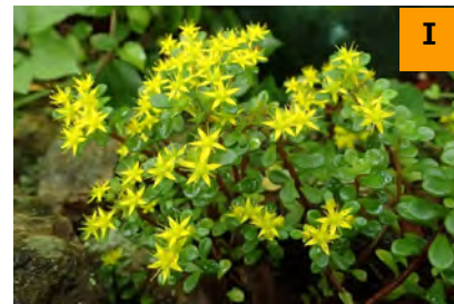
マルバマンネングサ (南園)