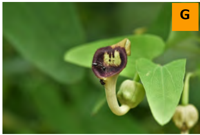
ウマノスズクサ (薬用区)