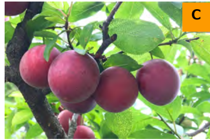
スモモ'メスレー' (こんこん山広場)