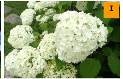
アメリカノリノギアナベル (南園)