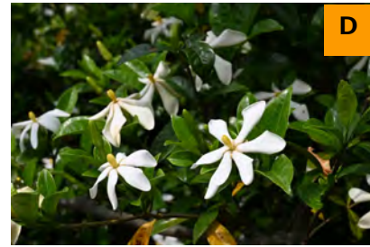
クチナシ (ふむふむ広場)