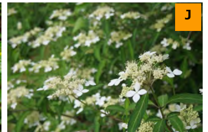
アマギアマチャ (結網山)