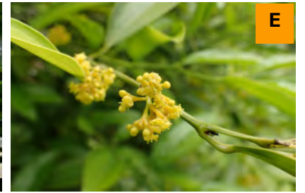
イソヤマアオキ (展示館周辺)