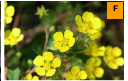
カワラサイコ (さくら・つつじ園)