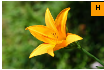
ノカンソウ (連絡道)